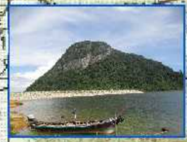
อ่างเก็บน้ำ คลองหัวช้าง