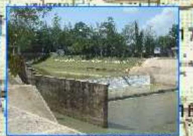
ฝายท่าเขียด

ศูนย์เรียนรู้การเพิ่มประสิทธิภาพการผลิตสินค้าเกษตร ตำบลท่ามะเตือ อำเภอบางแก้ว จังหวัดพัทลุง